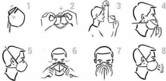
Cijfer 1: Instructies voor het gebruik van het masker